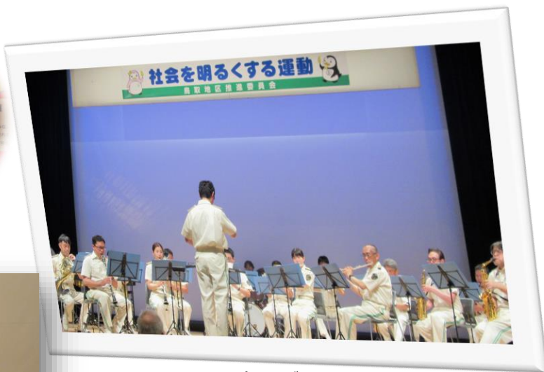
オープニングコンサート 鳥取県警察音楽隊